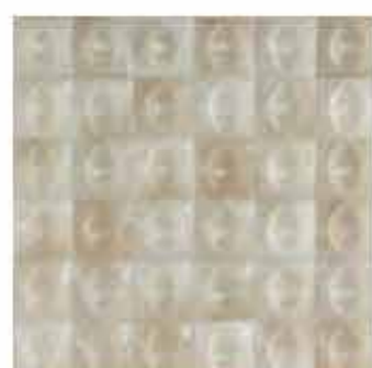
R80T 10x10 Beige Struttura Egg 3D