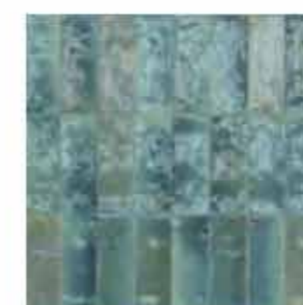
R8HA 7,5x20 Turchese