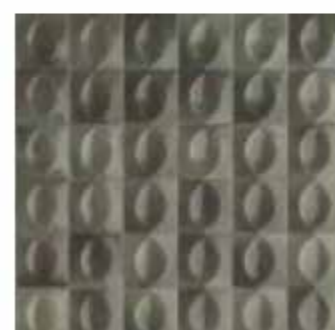
R8GW 10x10 Grigio Struttura Egg 3D