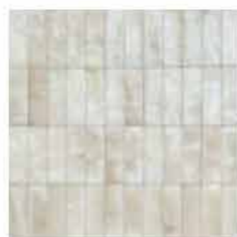
R8HN 5x15 Beige