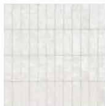
R8HM 5x15 Bianco