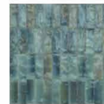
R8HP 5x15 Turchese