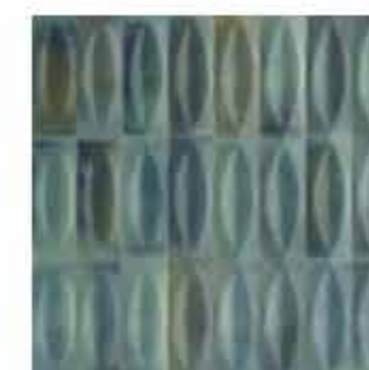
R8HH 7,5x20 Turchese Struttura Eye 3D