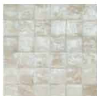
R80L 10x10 Beige