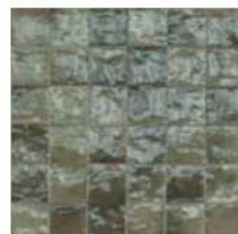
R8GP 10x10 Grigio