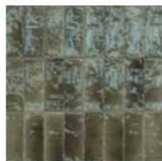
R8HD 7,5x20 Grigio