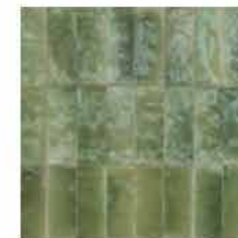
R8HC 7,5x20 Giada