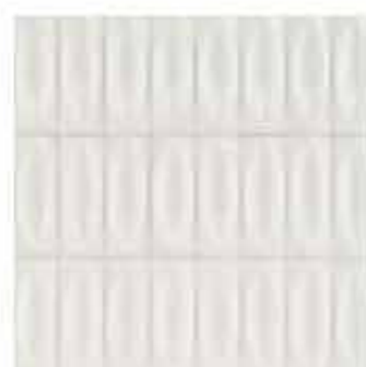
R8HF 7,5x20 Bianco Struttura Eye 3D