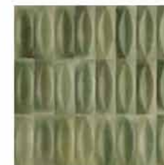
R8HJ 7,5x20 Giada Struttura Eye 3D