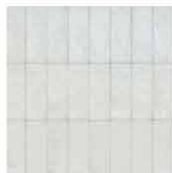
R80Y 7,5x15 Bianco