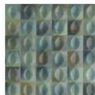
R80U 10x10 Turchese Struttura Egg 3D