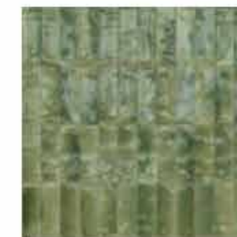
R8HQ 5x15 Giada