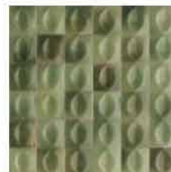
R80V 10x10 Giada Struttura Egg 3D