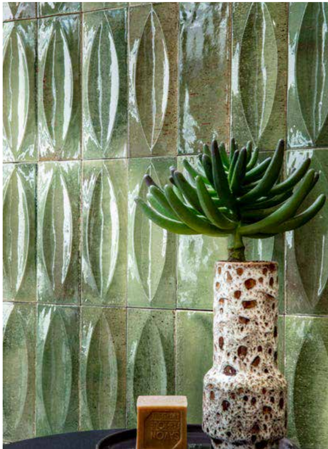
Cromie cangianti, superfici glossy e imperfezioni