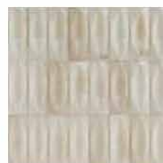
R8HG 7,5x20 Beige Struttura Eye 3D