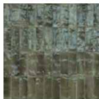
R8HS 5x15 Grigio