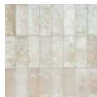
R80Z 7,5x20 Beige