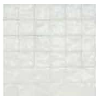
R80K 10x10 Bianco