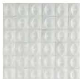
R80S 10x10 Bianco Struttura Egg 3D