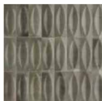
R8HK 7,5x20 Grigio Struttura Eye 3D