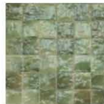
R80N 10x10 Giada