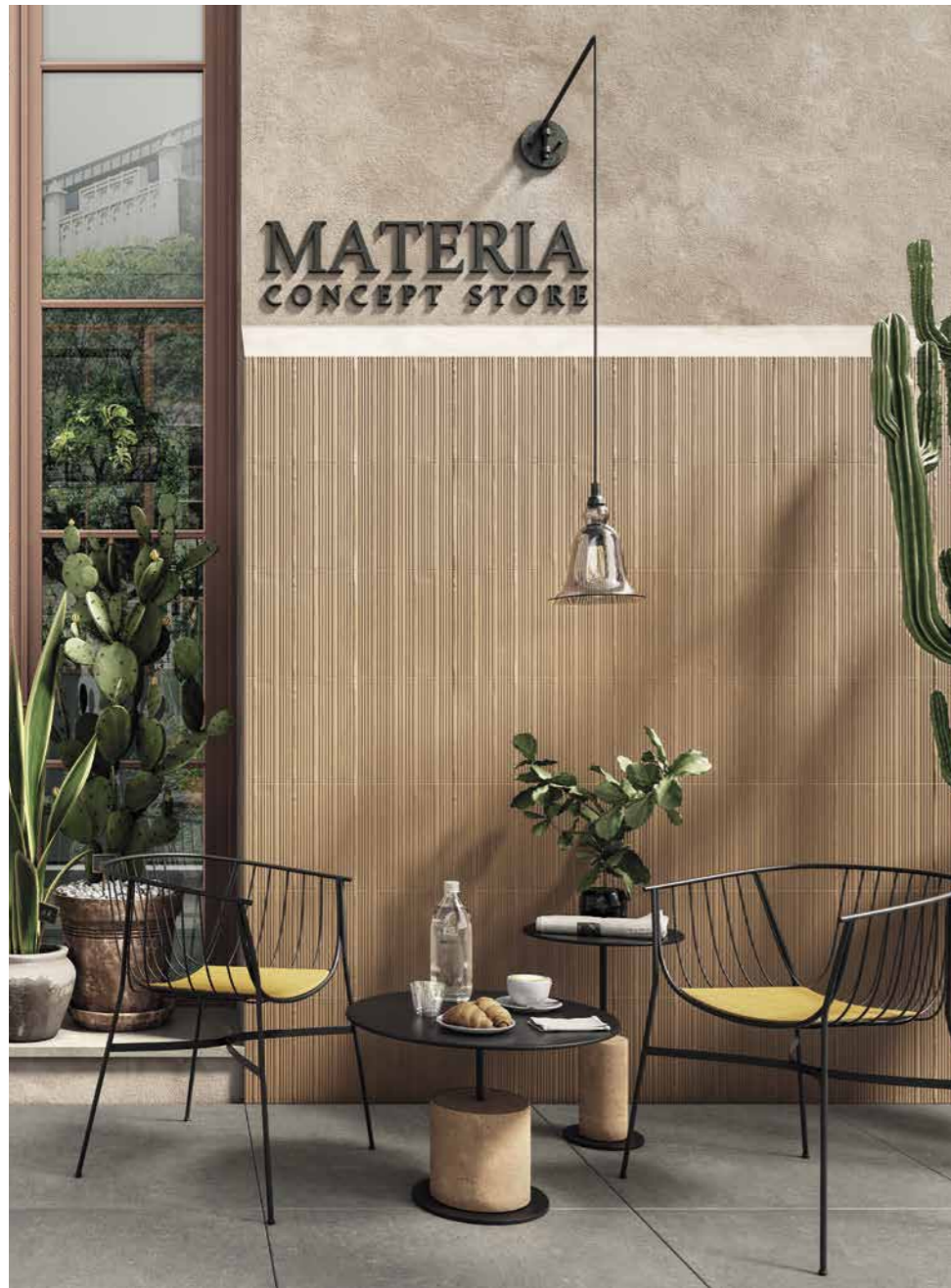
WALL TERRACOTTA MD 03 ARMOR 300X450 / 12"X18"