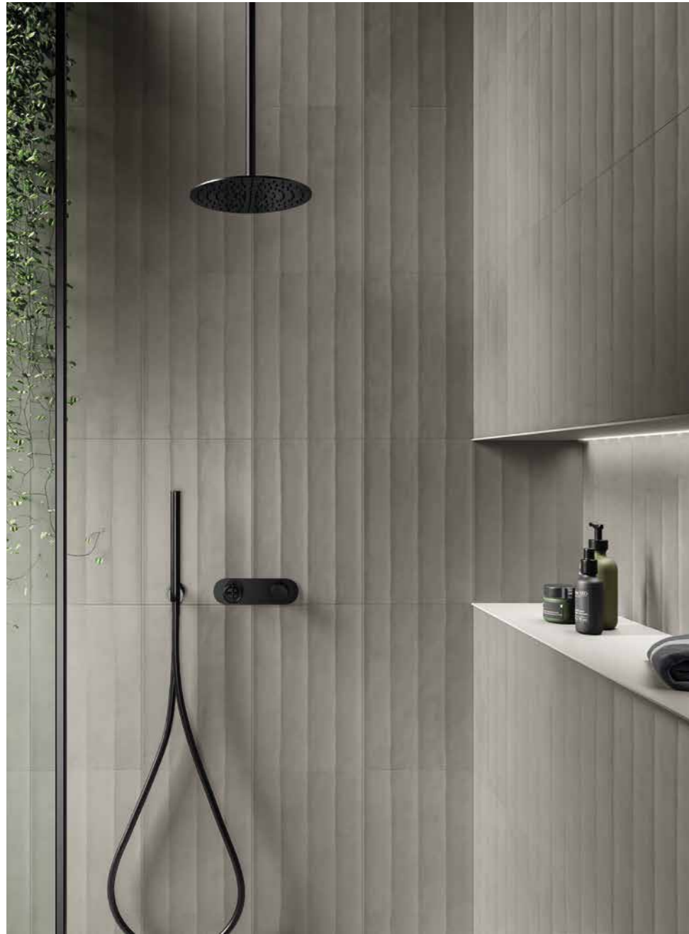
SHOWER GRIGIO MD 02 MELLOW 300X450 / 12"X18"