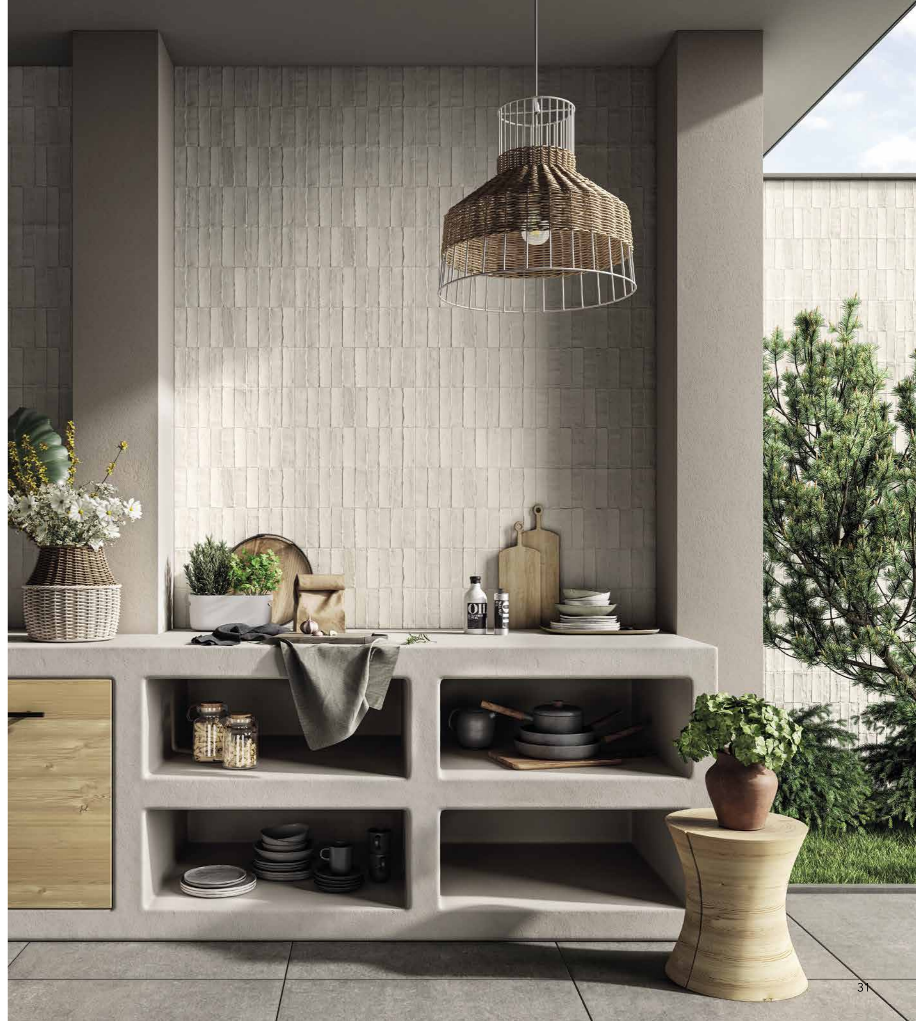
FLOOR NYUMA TORCHING NY 03 800X800 / 31 1/2"X31 1/2" ST SQ EVO_2/E 20 MM