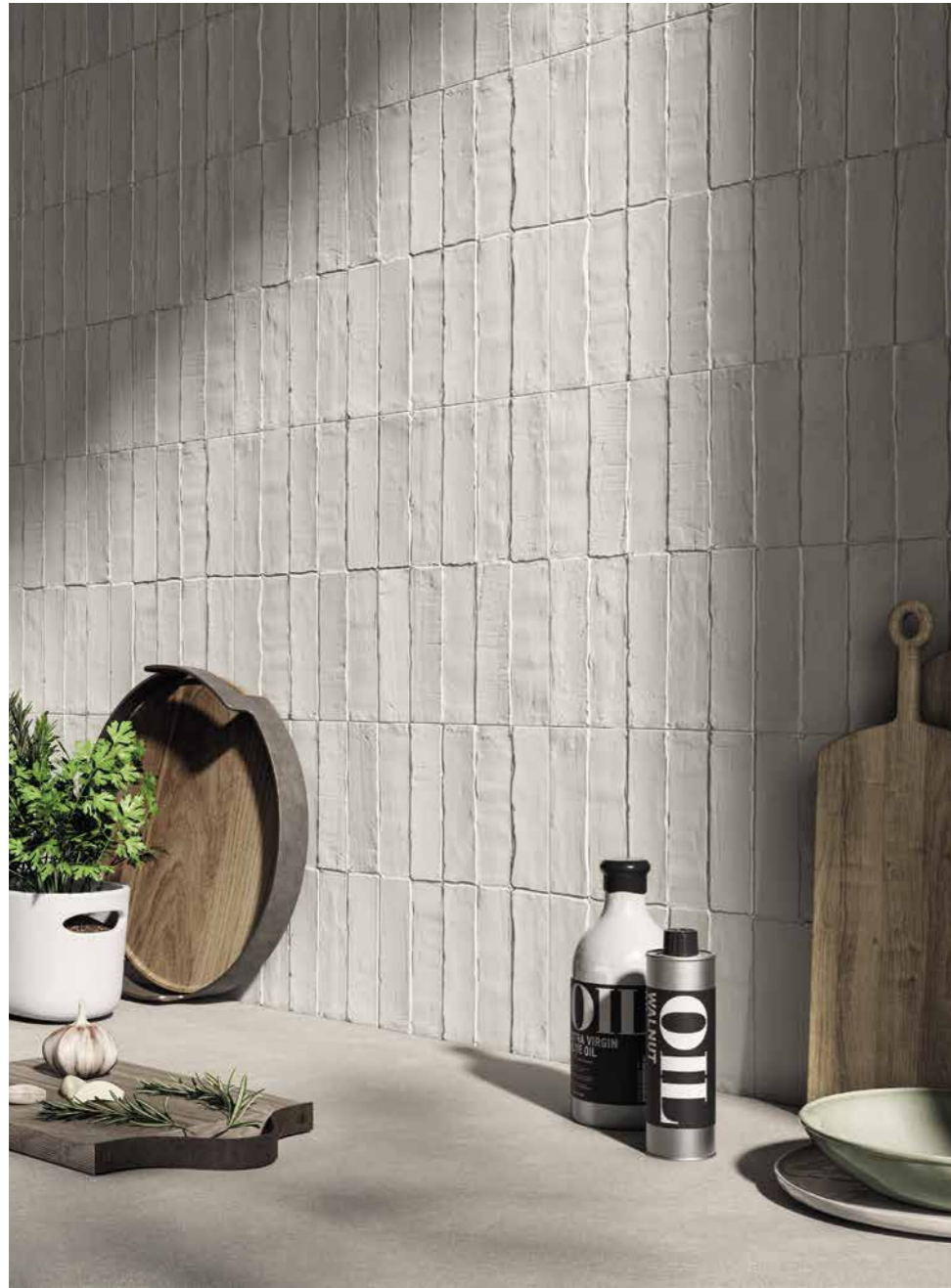
WALL BIANCO MD 01 DAWN 300X450 / 12"X18"