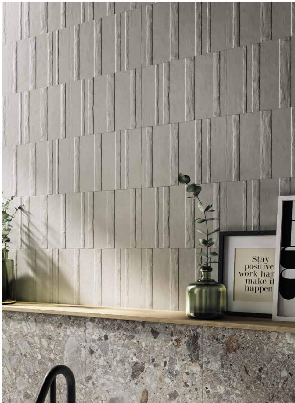
WALL GRIGIO MD 02 MUSE 300X450 / 12"X18" NORR FARGE RR 05 600X1200 / 24"X48" NAT SQ FLOOR NORR FARGE RR 05 800X800 / 31 1/2"X31 1/2" NAT SQ