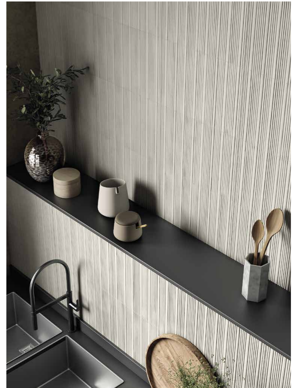
WALL BIANCO MD 01 ARMOR 300X450 / 12"X18"