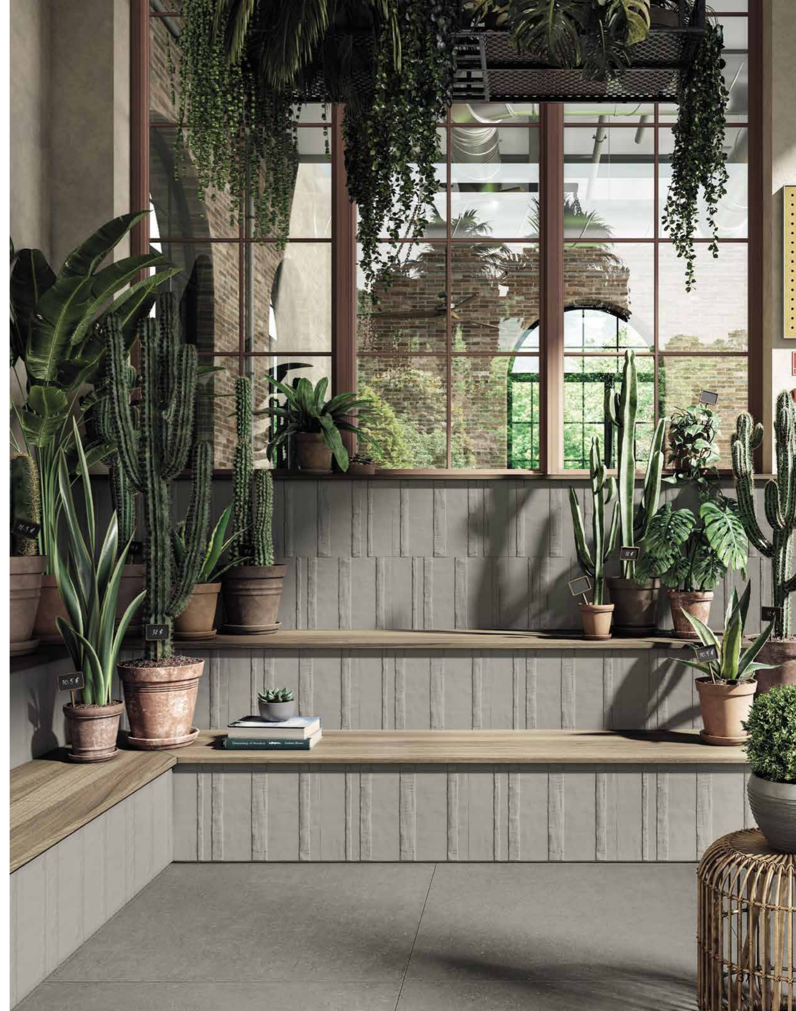
WALL GRIGIO MD 02 MUSE 300X450 / 12"X18"