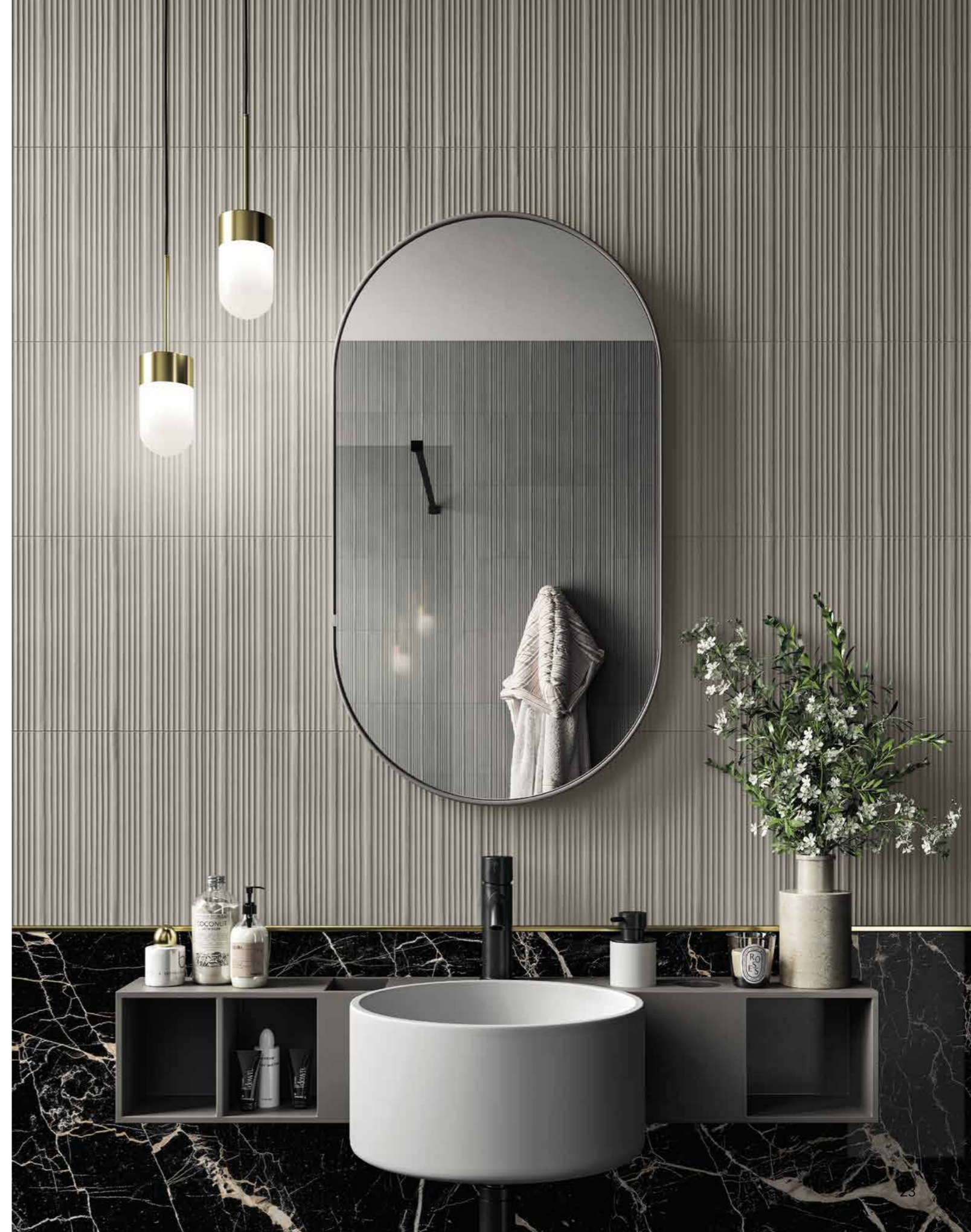
WALL GRIGIO MD 02 ARMOR 300X450 / 12"X18" WANDERLUST SAINT LAURENT WA 07 1200X2780 / 48"X110" LUC SQ