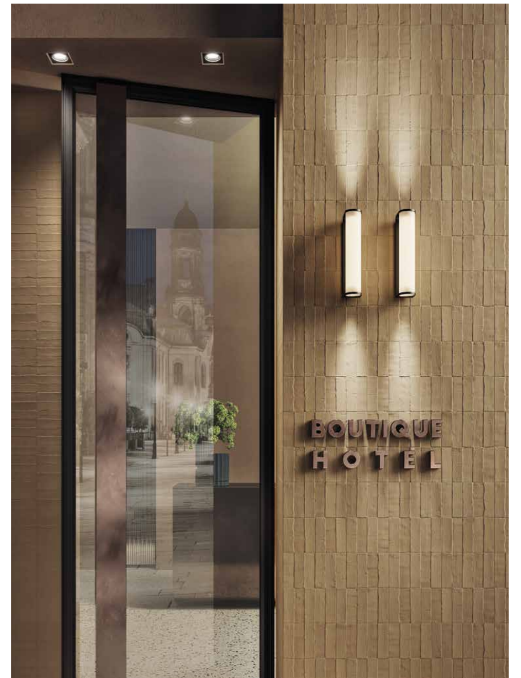
WALL TERRACOTTA MD 03 DAWN 300X450 / 12"X18" FLOOR VICEVERSA VENEZIANO 800X800 / 31 1/2"X31 1/2" SP SQ